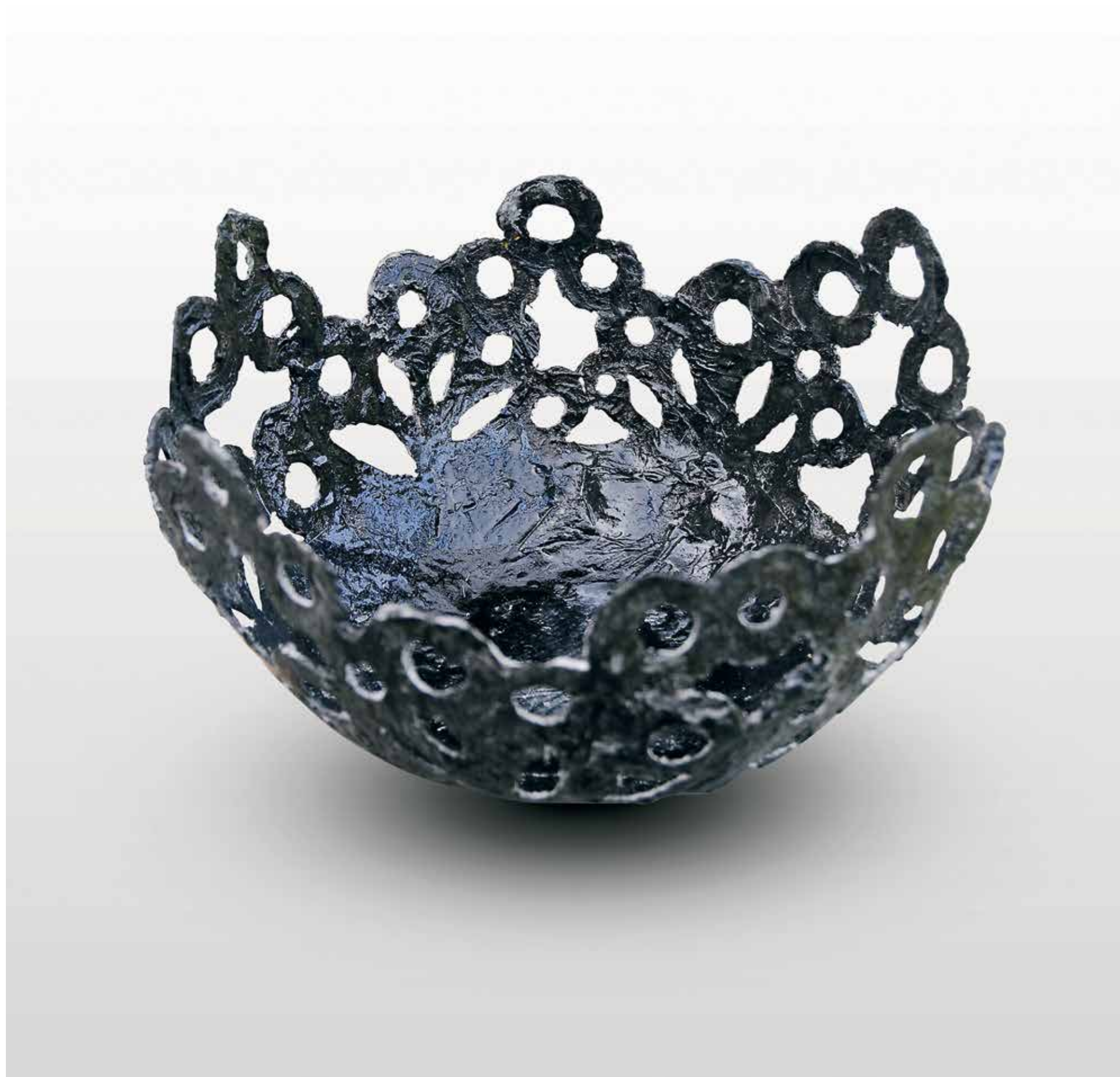
“Black Lace” bowl, 30-cm diameter, fiberglass and resin”. Coupe « Dentelle Noire », diamètre 30cm, fibre de verre et résine.