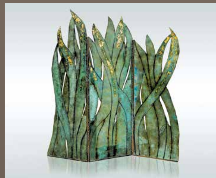
Folding screen "Bronze Leaves", 180 x 180cm, fiberglass and resin, patinated bronze, gold leaf. Paravent « Feuilles de bronze », 180 x 180cm, fibre de verre et résine, bronze patiné, feuille d'or.

NOUS L'AVIONS DÉCOUVERTE À PARIS DANS LES ANNÉES 90 GRÂCE À « LA LEÇON DE NATATION », UNE ÉTONNANTE SCULPTURE AQUATIQUE EXPOSÉE AU CENTRE WALLONIE-BRUXELLES. GENEVIÈVE BONIEUX A, DEPUIS CETTE ÉPOQUE, FAIT ÉVOLUER SON ART EN RESTANT TOUTEFOIS FIDÈLE À SON STYLE. SON ŒUVRE ACTUELLE SE DÉCLINE EN UNE SÉRIE D'OBJETS USUELS DÉTOURNÉS METTANT EN SCÈNE DES FANTAISIES SUBJECTIVES OU DES MYTHES DE TOUS TEMPS REVISITÉS DE MANIÈRE CONTEMPORAINE. PLONGEONS DANS L'UNIVERS FABULEUX DE CETTE PARISIENNE MAURICIENNE REVENANT TOUT JUSTE DE SINGAPOUR OÙ ELLE A EXPOSÉ DES CRÉATIONS RÉCENTES.