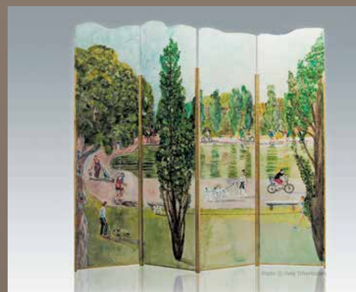
Folding screen « Parc de Sceaux », 200 x 200 cm, fiberglass and resin. Paravent "Parc de Sceaux" 200 x 200 cm, fibre de verre et résine