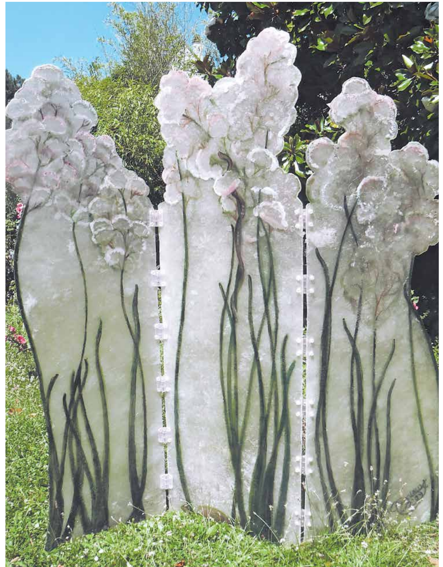
Folding screen "Flowers of Innocence", 180 x 180cm, fibreglass and resin. Paravent « Fleurs du Bien » 180 x 180 cm, fibre de verre et résine.

Pour découvrir d'autres œuvres de Geneviève Bonieux, explorez son site web www.bonieux.com