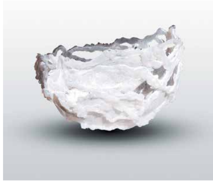
"White lace" bowl, 30-cm diameter, fibreglass and resin. Coupe « Dentelle Blanche », diamètre 30 cm, fibre de verre et résine.