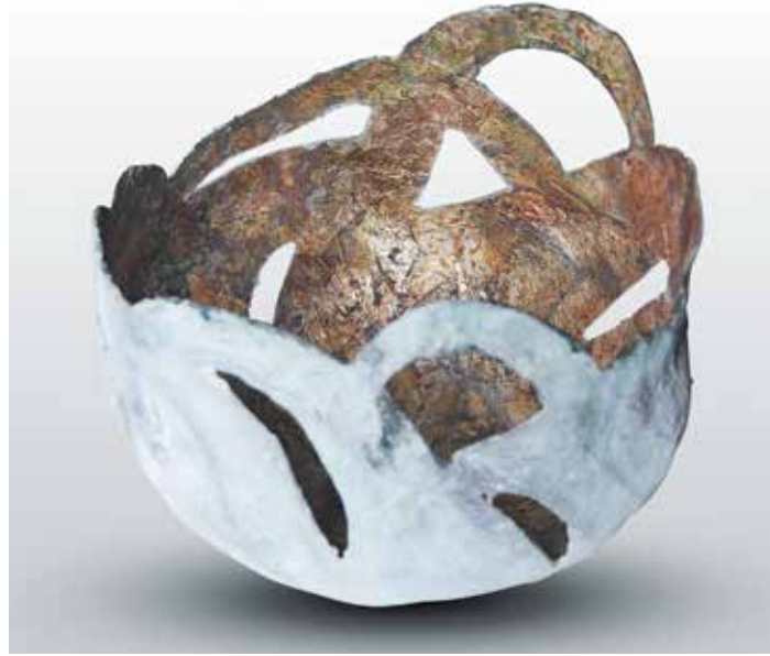
"Copper and bronze" bowl, 30-cm diameter, fibreglass and resin, copper, bronze patina. Coupe « Cuivre et bronze », diamètre 30 cm, fibre de verre et résine, cuivre, bronze patiné.