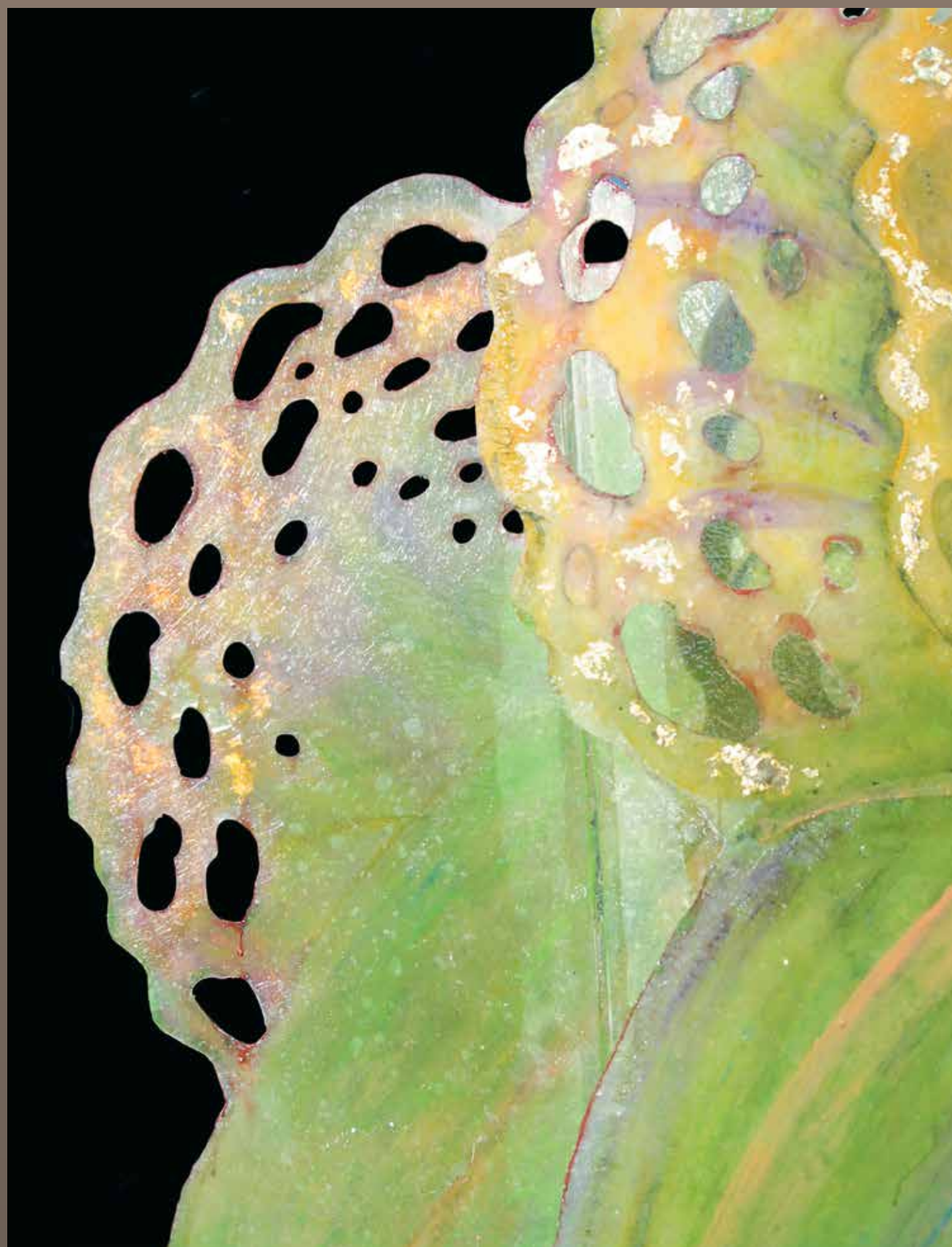
Folding screen "Golden Seaweed", 180 x 180 cm, fiberglass and resin. Paravent « Algue Précieuse », 180 x 180 cm, fibre de verre et résine.