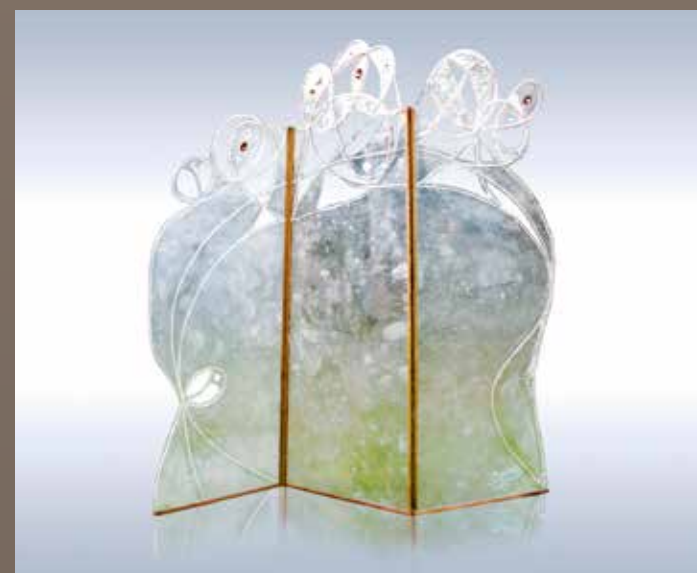
Folding screen "Jewels", 180 x 180 cm, fiberglass and resin. Paravent "Joyaux" 180 x 180cm, fibre de verre et résine